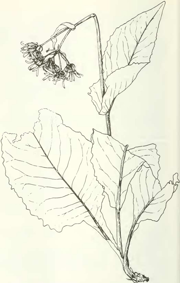
Abb. 5: Senecio farkharensis Podlech (PODLECH 10559) ca. 1/3 nat. Größe